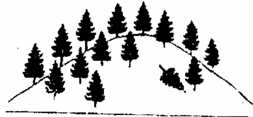
- C -